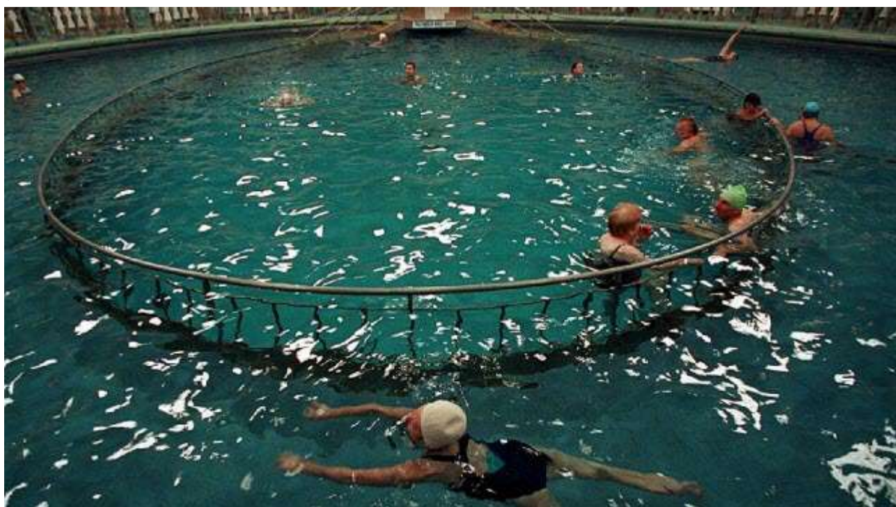
La piscine était peu profonde (1 m environ) sauf en sa partie centrale.