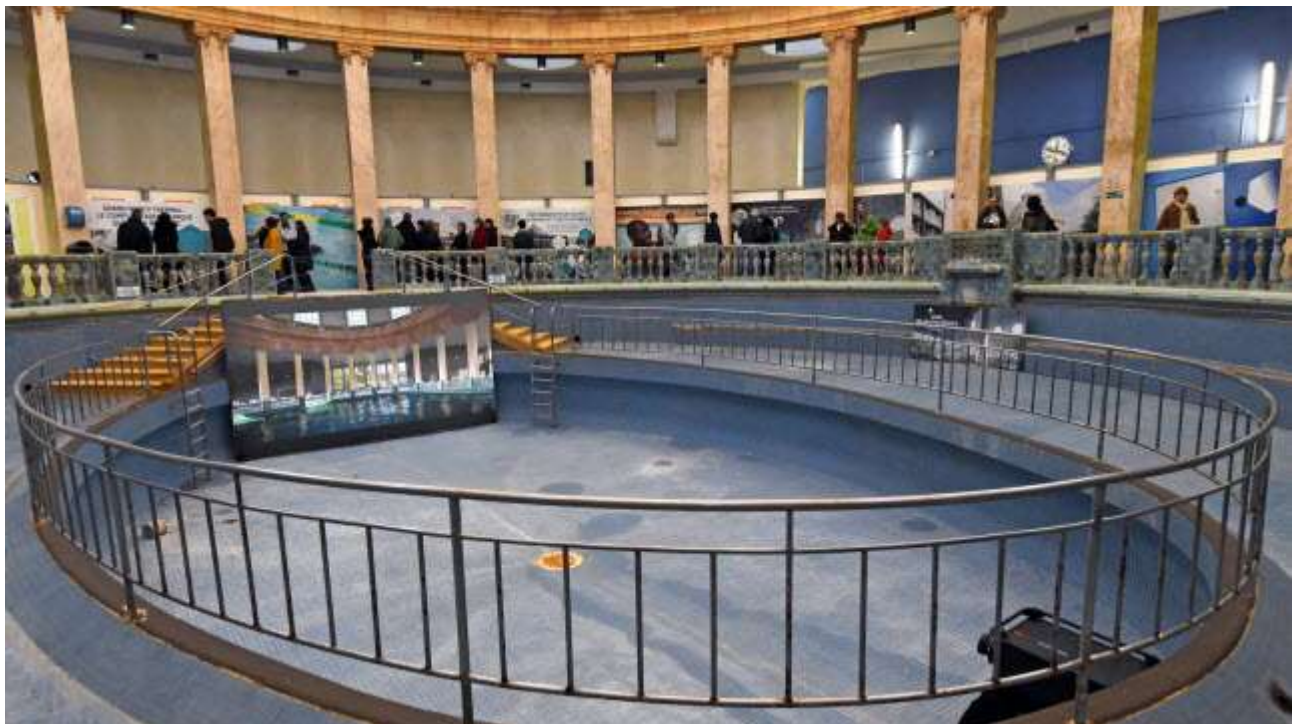
En janvier 2019, le public pouvait visiter le site, en cours de restructuration.