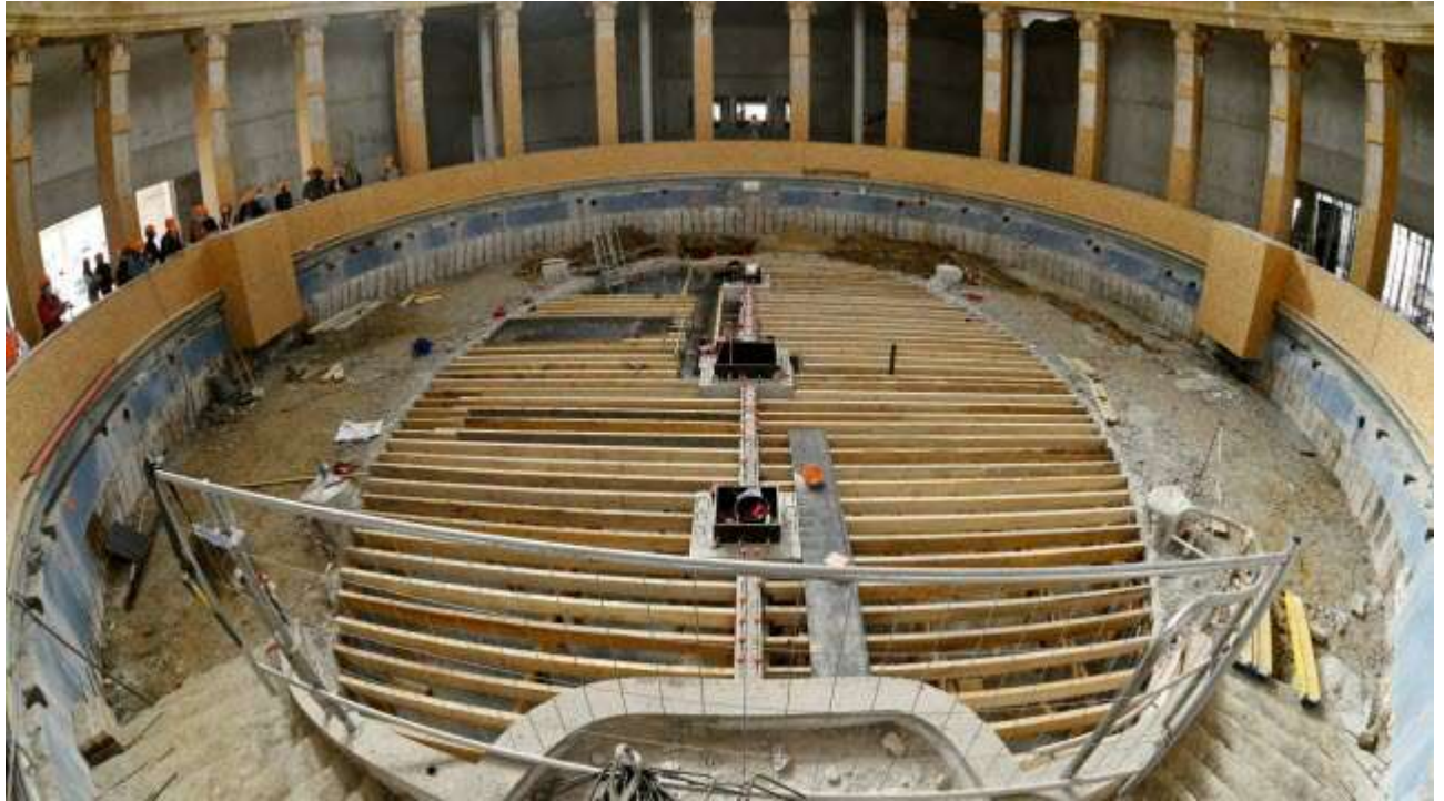
Durant les travaux de rénovation, le bassin a été modifié : on y a notamment pied partout, désormais.